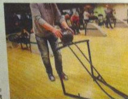
Det finns hjälpmedel även för den som är förlamad i armen.